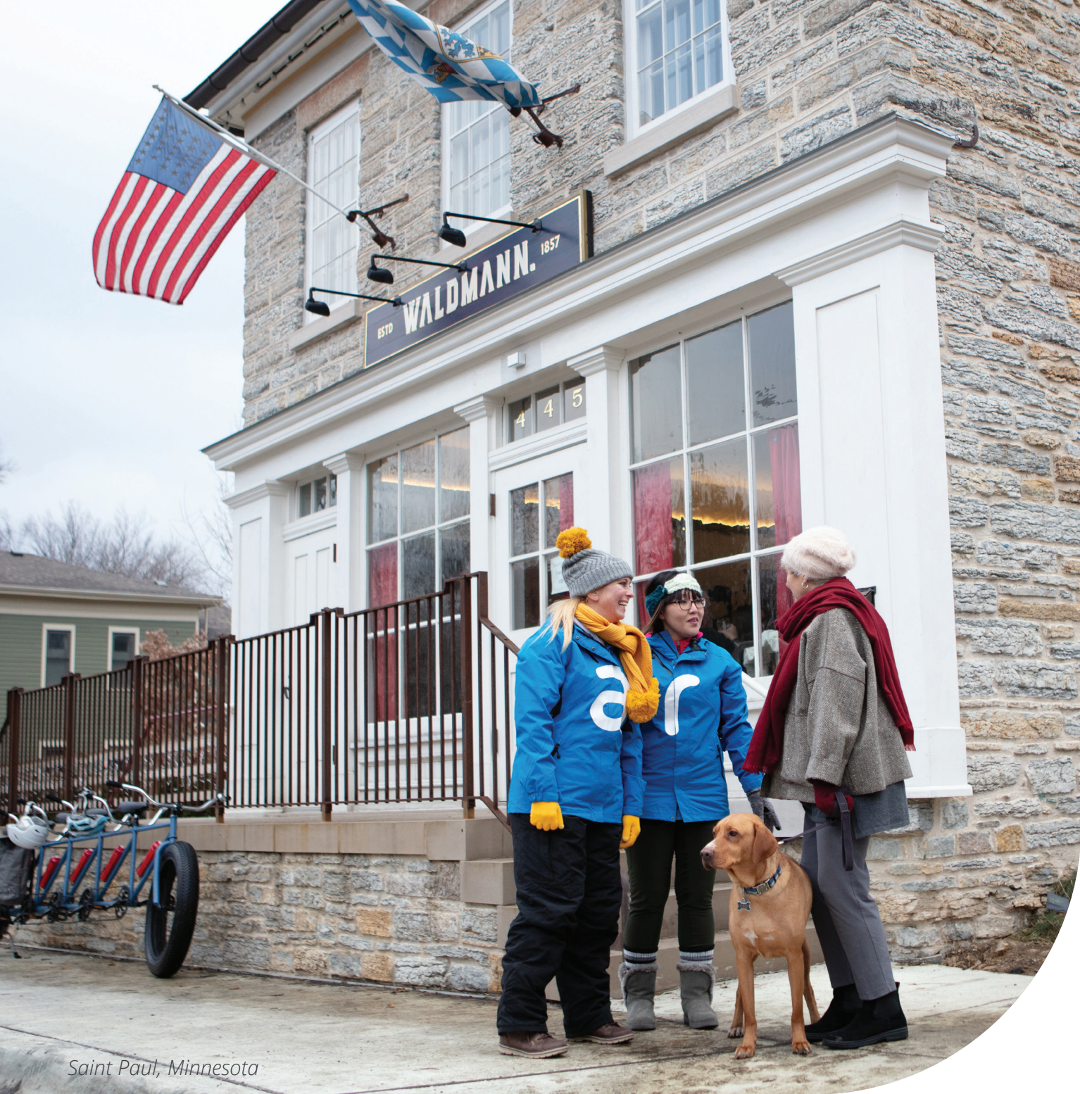
Saint Paul, Minnesota